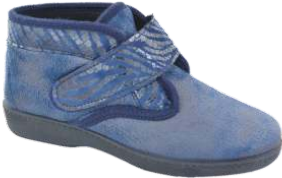
Home 48 dal 35 al 41 Colori: Nero, Blu