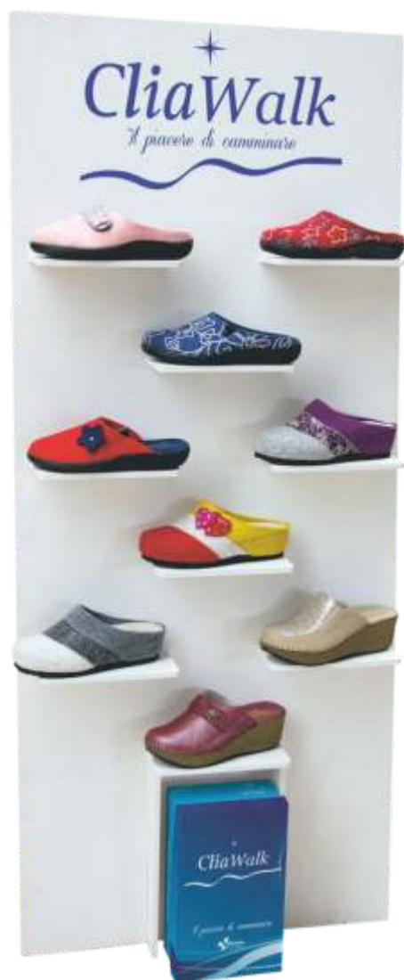
Espositore Premium (con un ordine minimo di 120 paia)