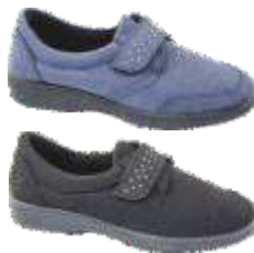
Home 59 XL dal 35 al 41 Colori: Blu, Nero, Grigio