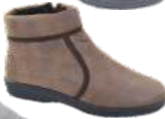
Home 54 dal 35 al 41 Colori: Blu, Nero, Grigio