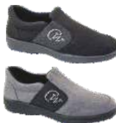
Home 61 XL dal 35 al 41 Colori: Grigio, Nero, Blu